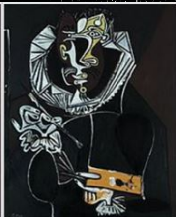
The Portrait of a Painter after El Greco (1950, oil on plywood, 100.5 x 81 cm, Angela Rosengart Collection, Lucerne) is Picasso's version of the Portrait of Jorge Manuel Theotocopoulos.