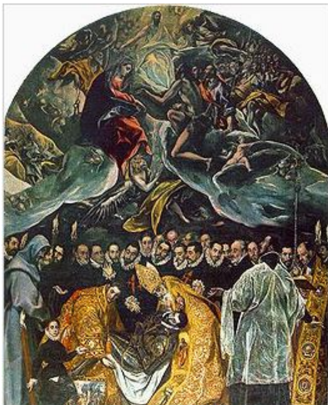
Ταφή του κόμη του Οργάθ (1586-88), Λάδι σε μουσαμά, 480x360 εκ., Τολέδο, Άγιος Θωμάς.

Τρίτη, 06 Μάιος 2014 18:43 - Τελευταία Ενημέρωση Τρίτη, 06 Μάιος 2014 19:58